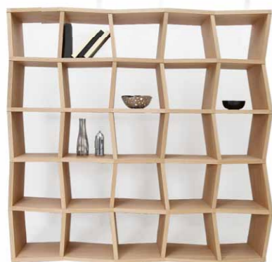
Knihovna Tatry s originálním designem v dýhovaném či matném emailovém provedení. Nabízí možnost rozměrové variability, lze vyrobit i jako atyp. Autor Ivan Čobej doporučuje prostorové varianty – u zdi nebo v prostoru

Je mnoho firem, které jsou kapitálově úspěšnější, protože jsou úzce specializované. Naše síla je bezesporu v komplexnosti. Mnozí mohou být